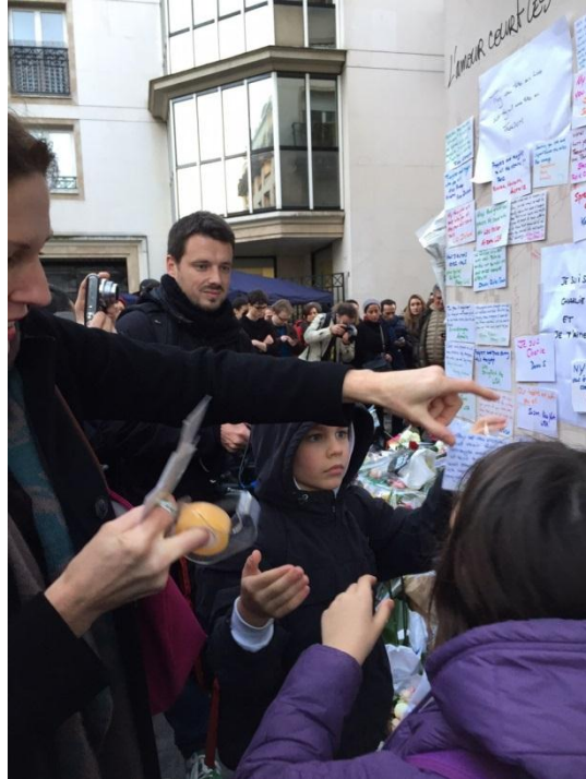
الأطفال مع الأهل وتسجيل رفضهم للحادث

وفيما يلي، بعض صور لوقف احتجاجية أمام صحيفة شارلي إبدو في باريس ضد الاعتداء على الصحيفة والتعبير عن مساندتها