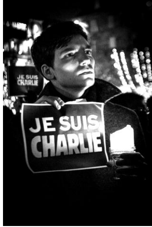
صورة من مظاهرة في "ستراسبورغ" (Strasbourg)

وفيما يلي، بعض صور لوقف احتجاجية أمام صحيفة شارلي إبدو في باريس ضد الاعتداء على الصحيفة والتعبير عن مساندتها